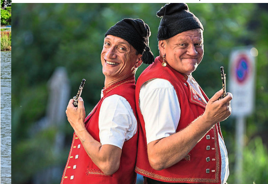
Messer & Gabel